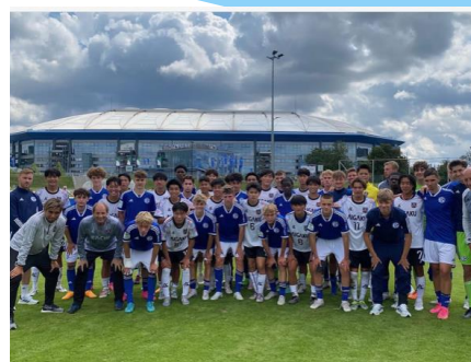
いいね！ 51件 toshinori.uefune 相生学院高校 vs シャルケ04 U-17 前半 0-1 後半 0-2 合計 0-3 敗戦