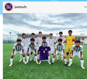
いいね！ 259件 joetsufc 【県リーグ】 1部リーグ (N1) 第12節 上越 2-2 開志学園JSC 得点: 松澤 (上越春日FC) 白井 (スクデットFC)