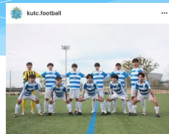
「いいね！」 63件 kutc.football 三重県高校サッカー新人大会 3回戦 vs 伊勢工業 4対1