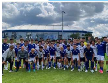
いいね！ 51件 toshinori.uefune 相生学院高校 vs シャルケ04 U-17 前半 0-1 後半 0-2 合計 0-3 敗戦