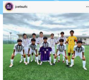
いいね！ 259件 joetsufc 【昇リーグ】 1部リーグ (N1) 第12節 上越 2-2 関志学園JSC 得点: 松澤 (上越春日FC) 白井 (スクデットFC)