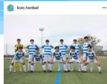
いいね！ 63件 kutc.football 三重県高校サッカー新人大会 3回戦 vs 伊勢工業 4対1